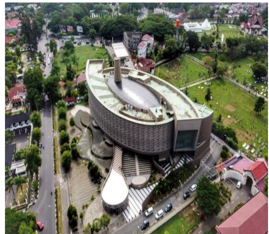
Gambar 4. Museum Tsunami Aceh

Museum yang menjadi salah satu icon Kota Banda Aceh ini merupakan salah satu bangunan yang menerapkan design post modern yang diadopsi dari bangunan Rumoh Aceh . Lantai dasar dari Museum Tsunami Aceh ini mengambil filosofi dari kolom Rumoh Aceh, di buat terbuka sebagai antisipasi pada saat terjadi bencana. Design ornamen fasad merupakan filosofi dari tari tradisional Aceh, yaitu tari