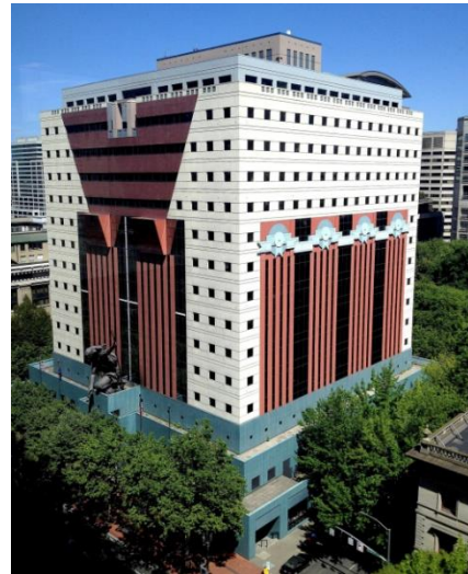
Gambar 2. Public Services Building

Dibangun pada tahun 1980-1982 oleh seorang arsitek asal Amerika Serikat Michael Graves, gedung ini menjadi pelopor dan banyak memberikan inspirasi pada perkembangan arsitektur post modern. Bentuk globalnya sangat sederhana, menyerupai kotak atau blok, ada yang berpendapat gedung ini menyerupai kotak kado natal raksasa, bahkan ada pula yang berpendapat gedung ini seperti dadu.