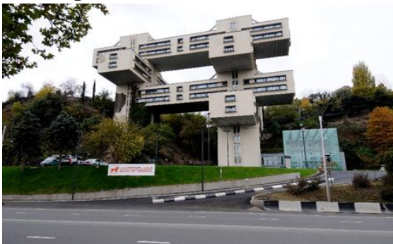
Gambar 1. National Bank of Georgia

Gedung yang dulu difungsikan sebagai kantor pusat kementerian perhubungan ini terletak di ibu kota Georgia, Tbilisi. Bangunan yang terletak di daerah berkontur pegunungan dengan bukitnya yang curam ini dibangun oleh para arsitek Georgia. Dengan luas bangunan 10.960 m 2 , gedung ini memiliki 18 lantai dengan lima struktur horizontal yang saling menumpuk satu sama lain.