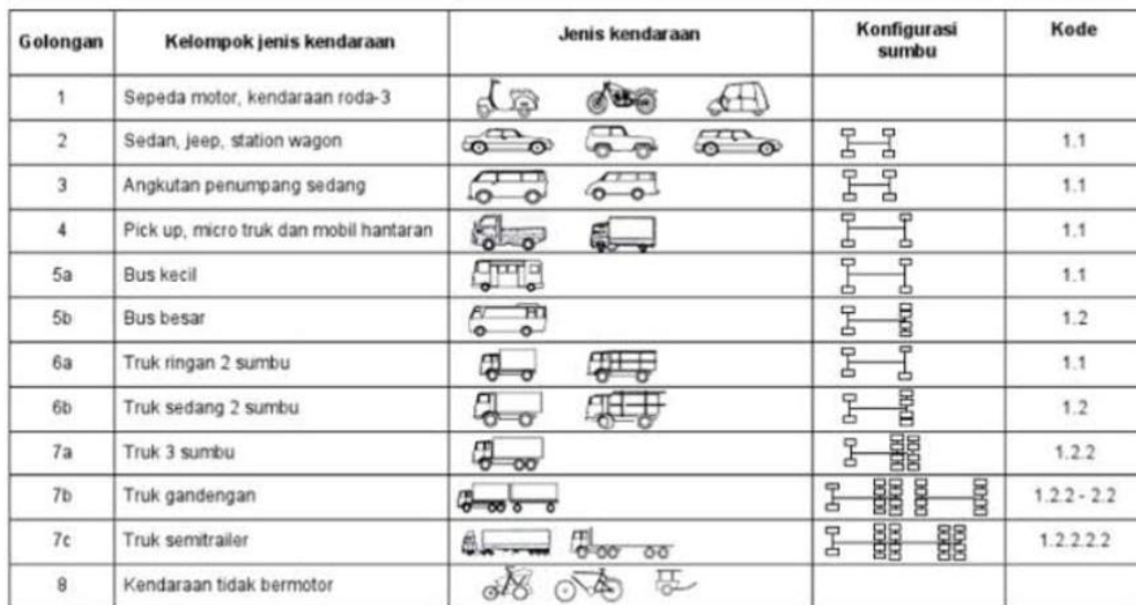
Gambar 1. Golongan dan Kelompok Kendaraan

Beban lalu lintas adalah jumlah kendaraan atau volume kendaraan yang melewati suatu ruas dalam periode tertentu [12]. Beban lalu lintas merupakan beban yang dialami perkerasan jalan akibat kontak ban kendaraan, beban ini bisa dihitung berdasarkan berikut ini: